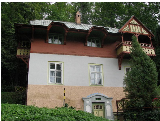
obr.č.7 - vila Chaloupka