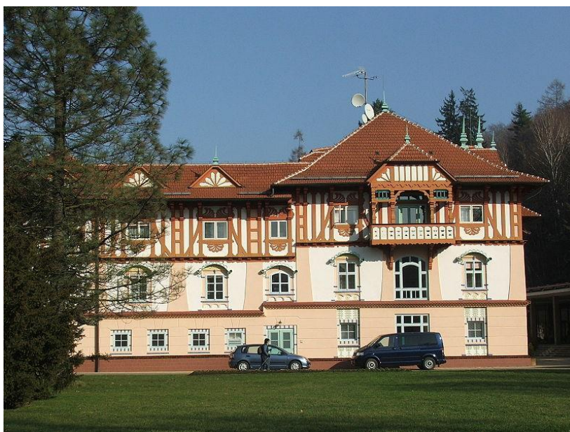
obr.č.6 - Jurkovič. dům