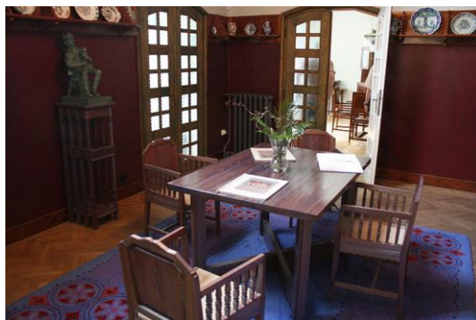
obr.č.5 ..... obr.č.6.....