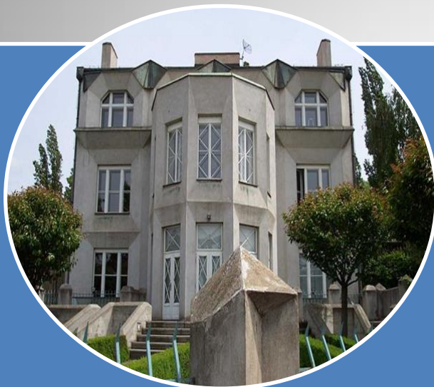
Josef Chochol, vila č.49