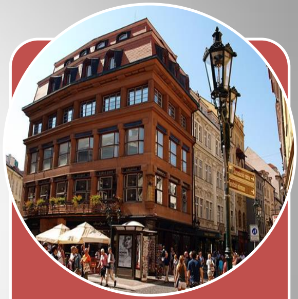
Josef Gočár, Dům U Černé matky boží