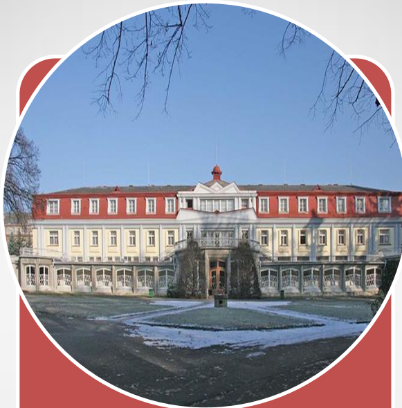
Josef Gočár, lázně Bohdaneč