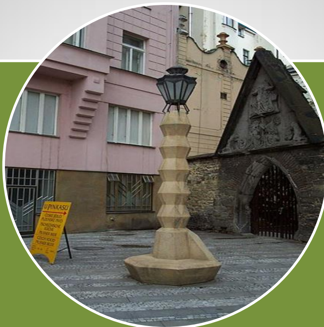
Emil Zajíček, kubistická lampa na Můstku v Praze